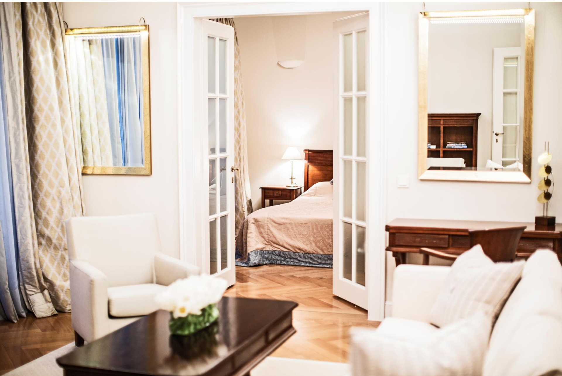
Residenza Suite, Antoinette