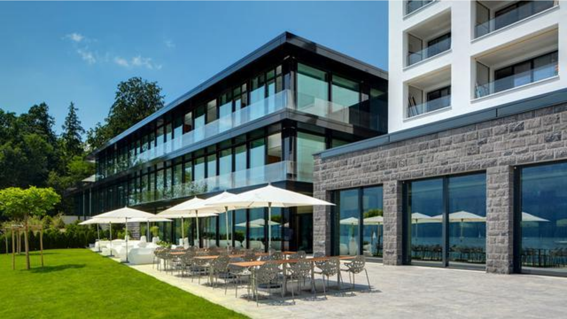
Campus Hotel Hertenstein