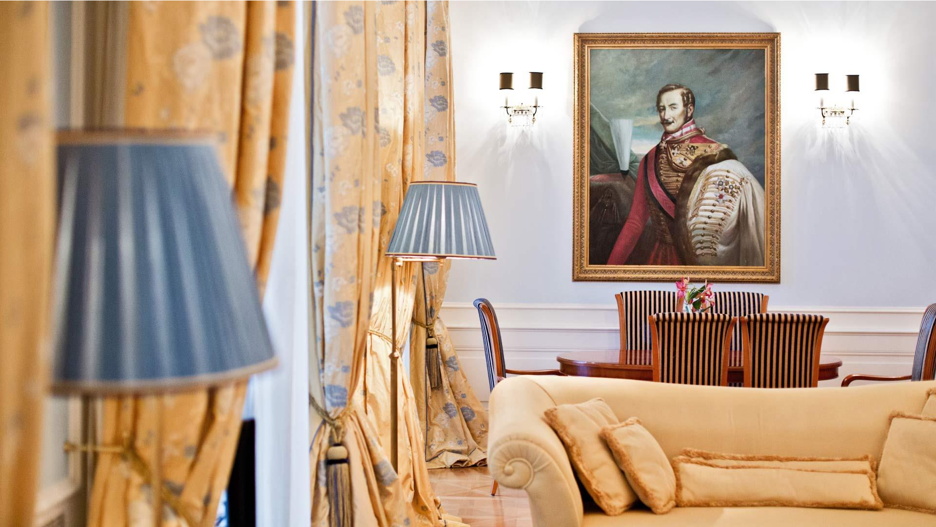
Bastei Suite, Ferdinand