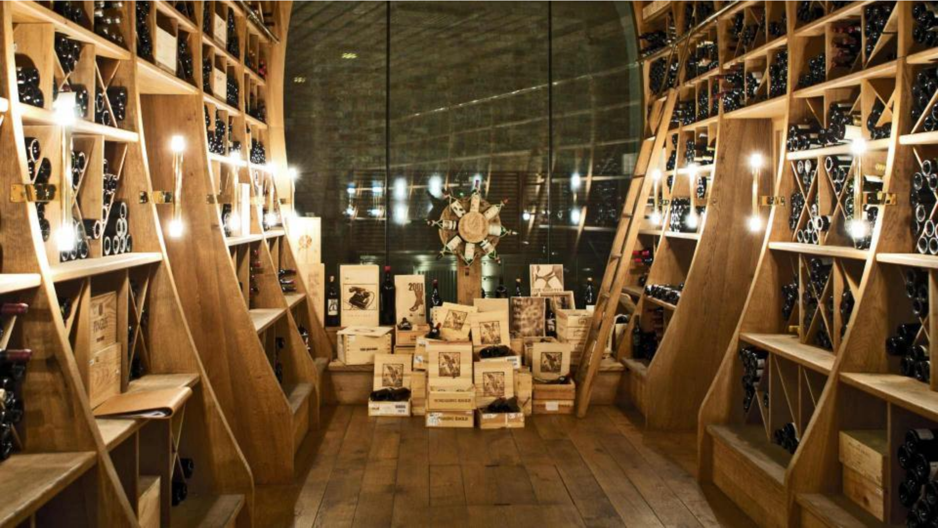
Neue Welt Keller