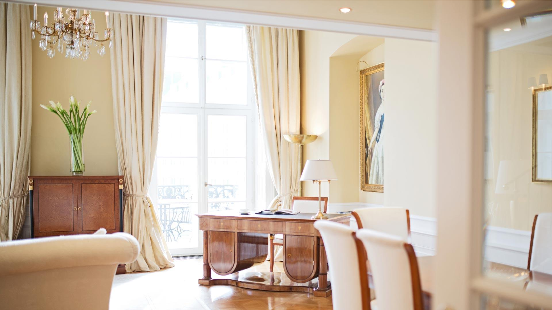
Coburg Suite, Victoria