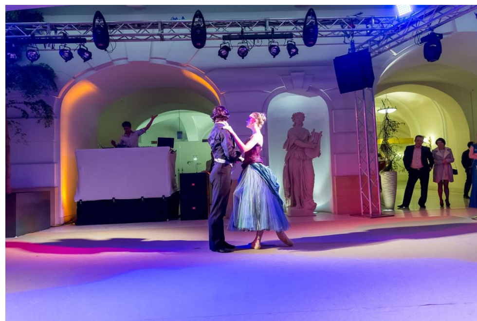
Weihnachten & Silvester