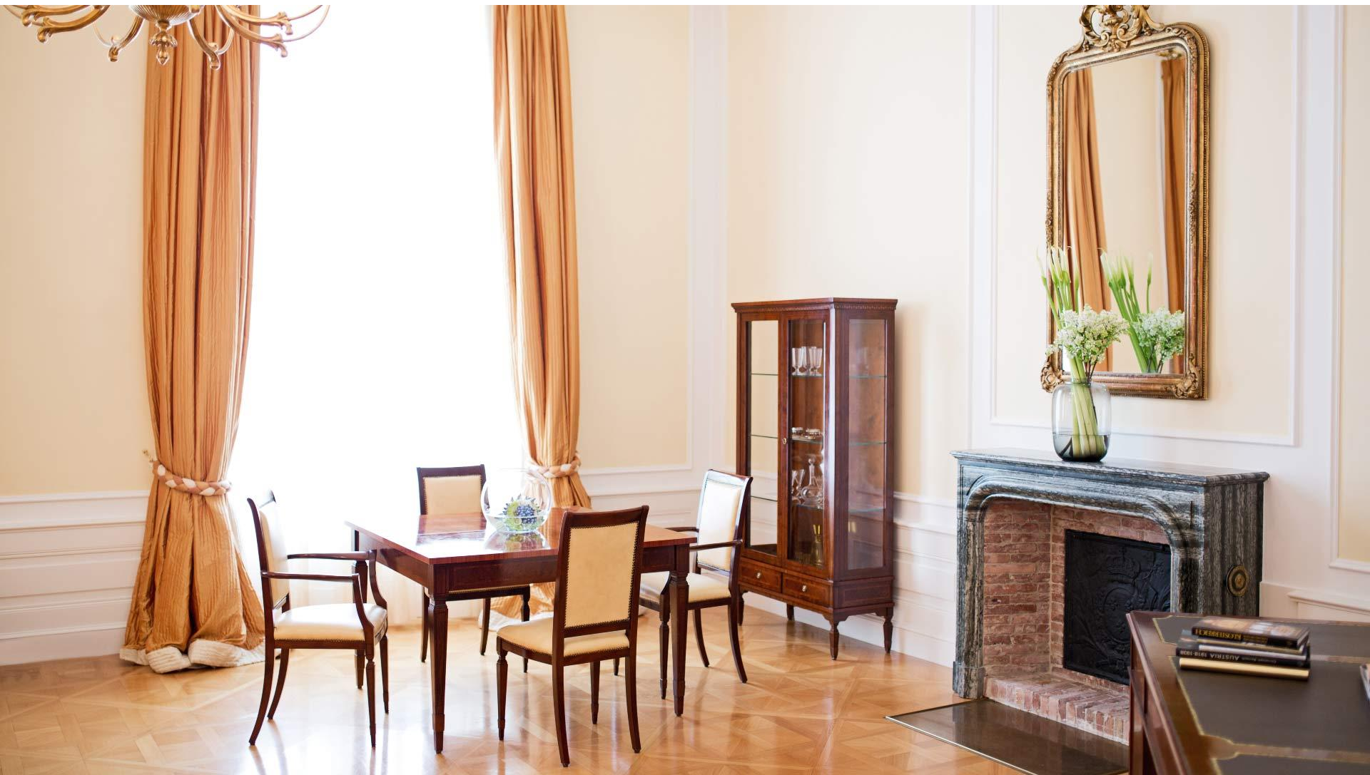
Residenza Suite, Dom Fernando