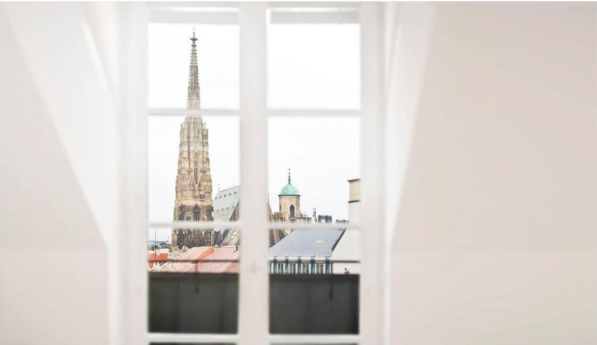
Palais Suite, Loft