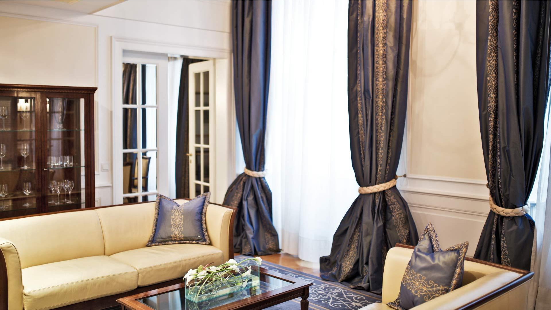
Bastei Suite, Boris