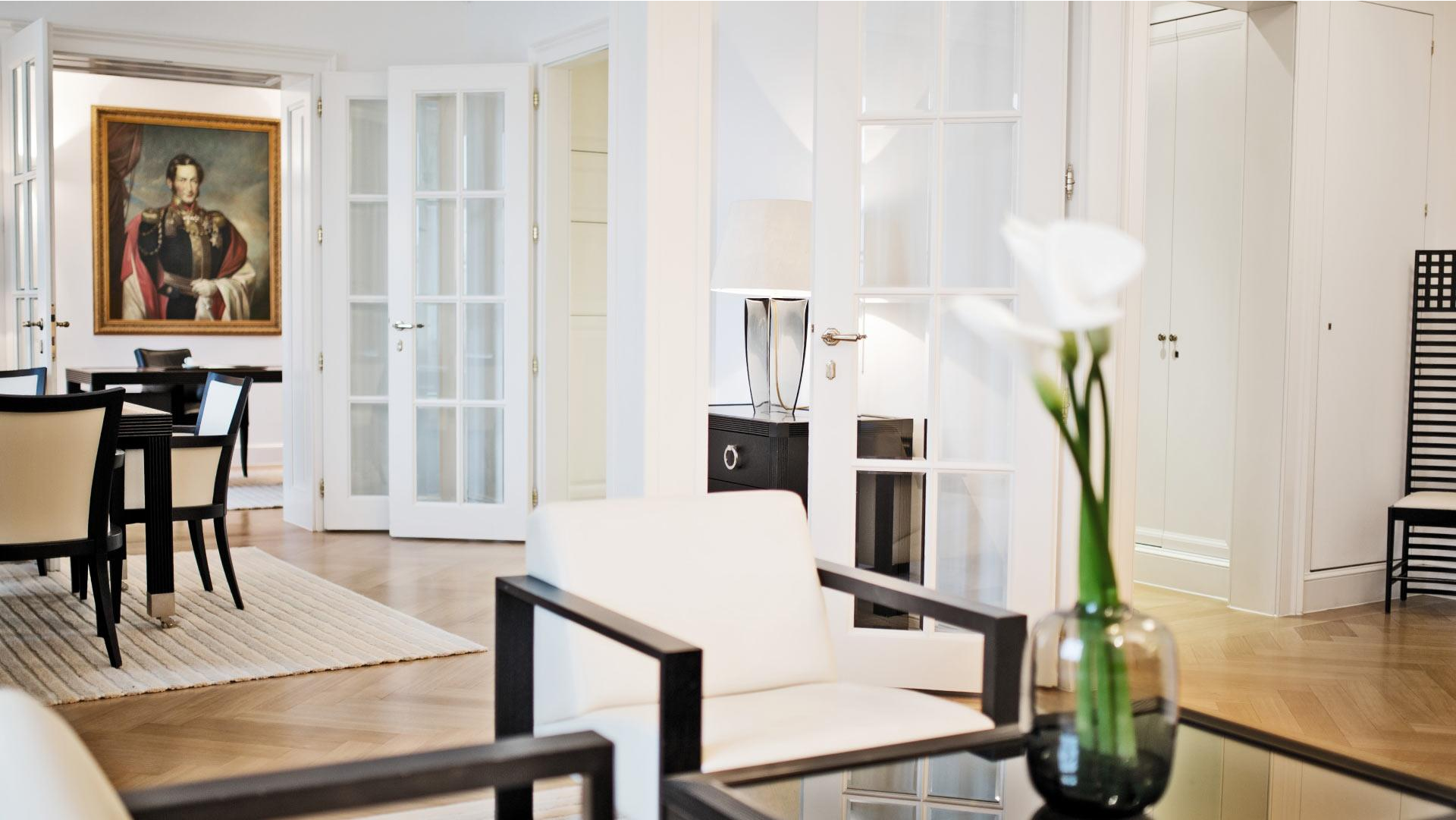
Palais Suite, Ernst