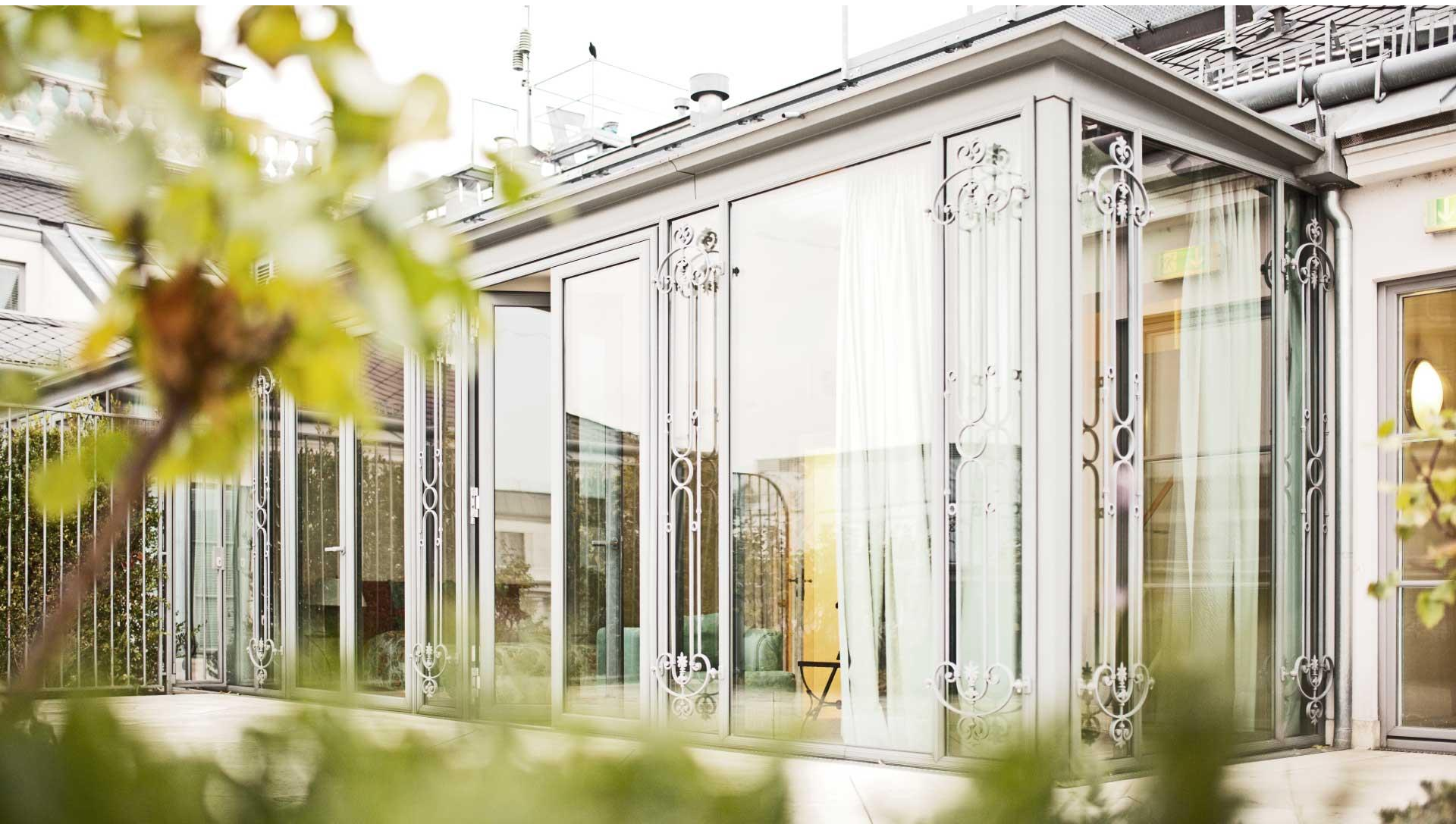
City Suite, Wintergarten