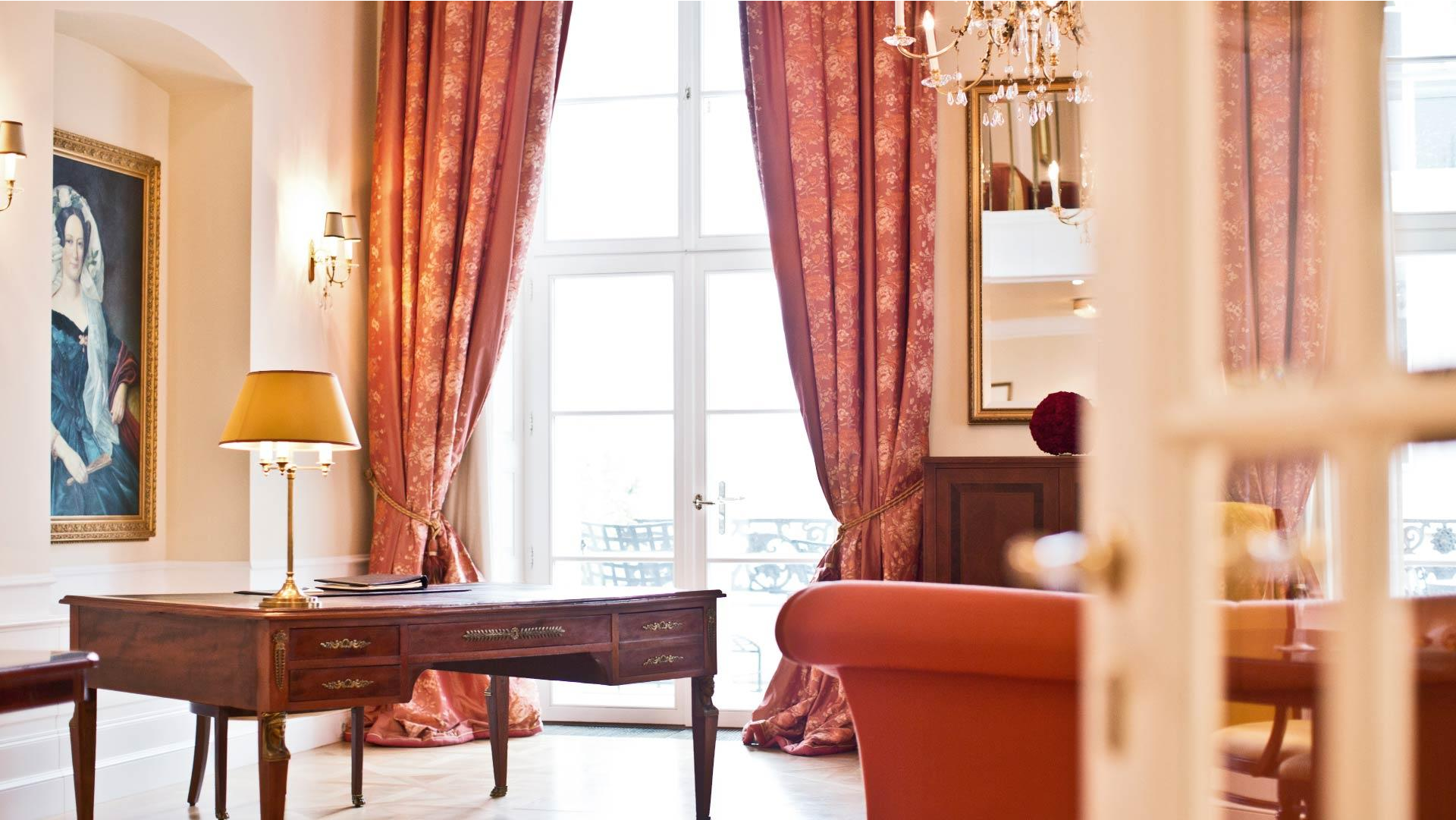
Coburg Suite, Marie-Antonie