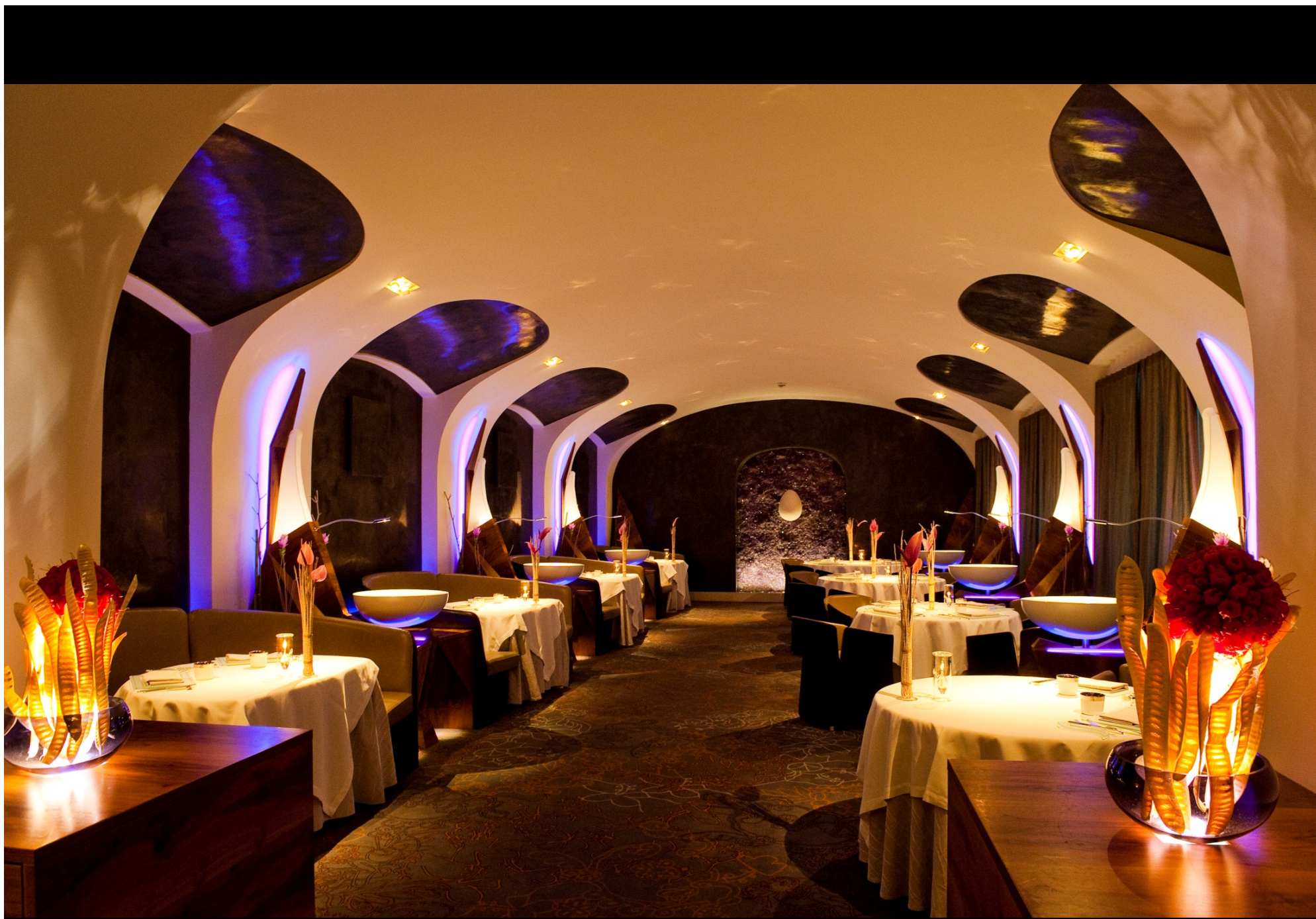
Гурме-ресторан Сильвио Никола