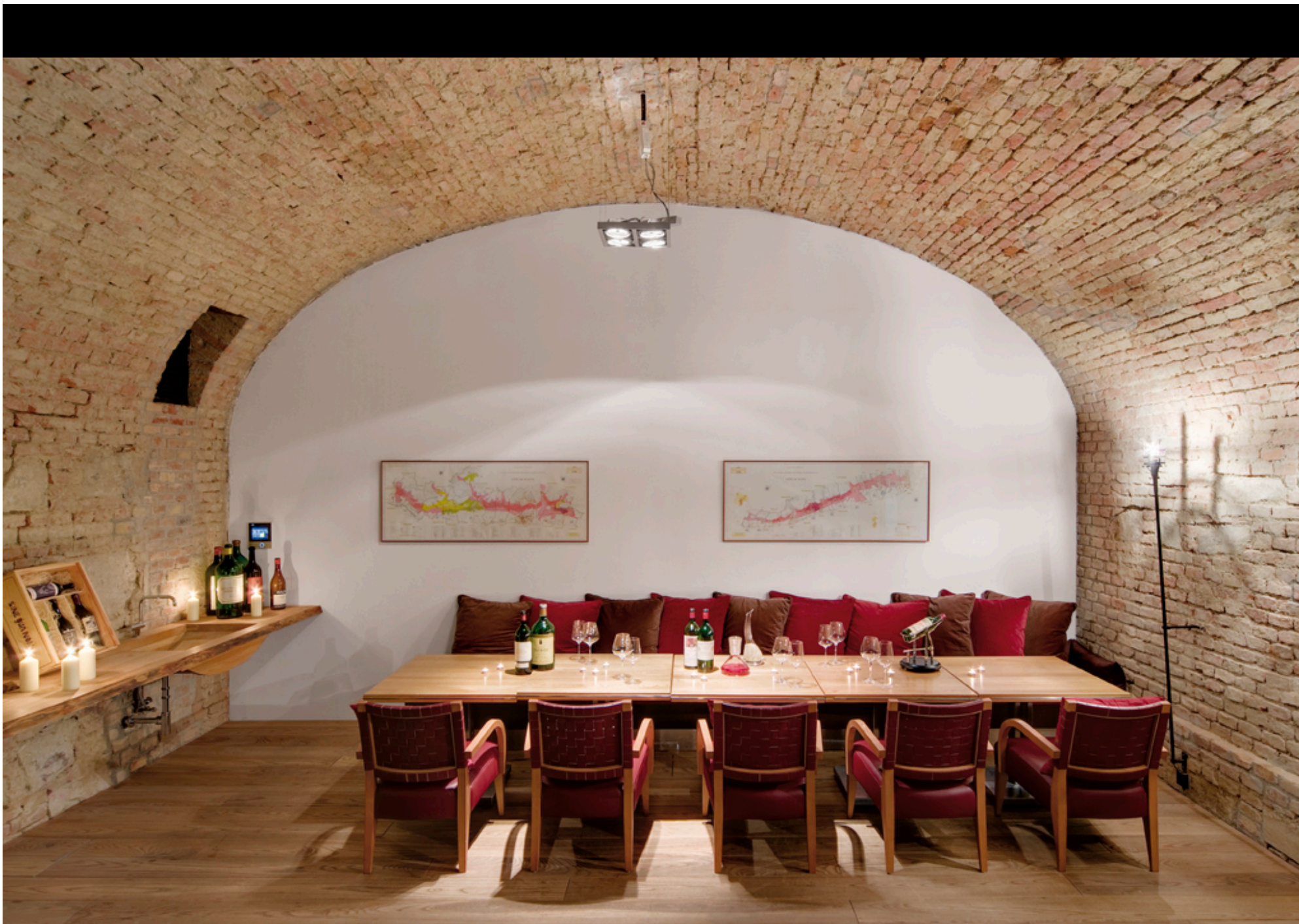
Свод «Старый мир»