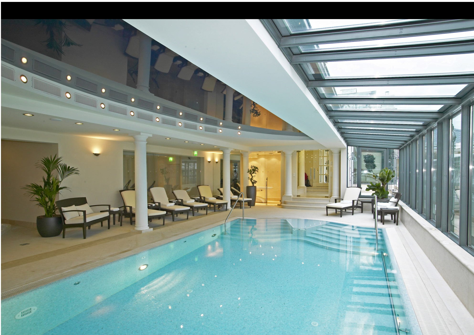
Дворец Кобург Спа