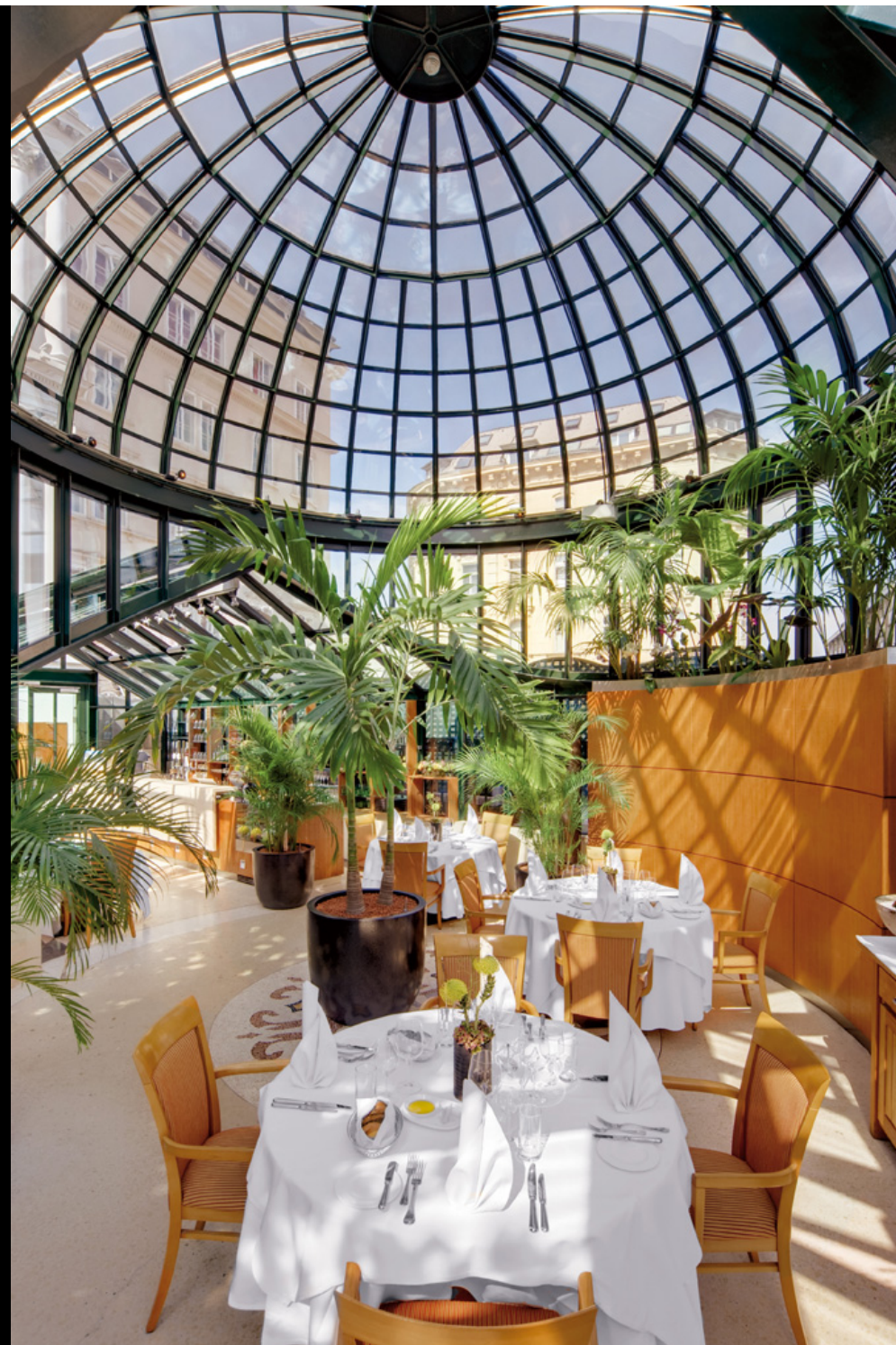
Р е с т о р а н Basteigarten