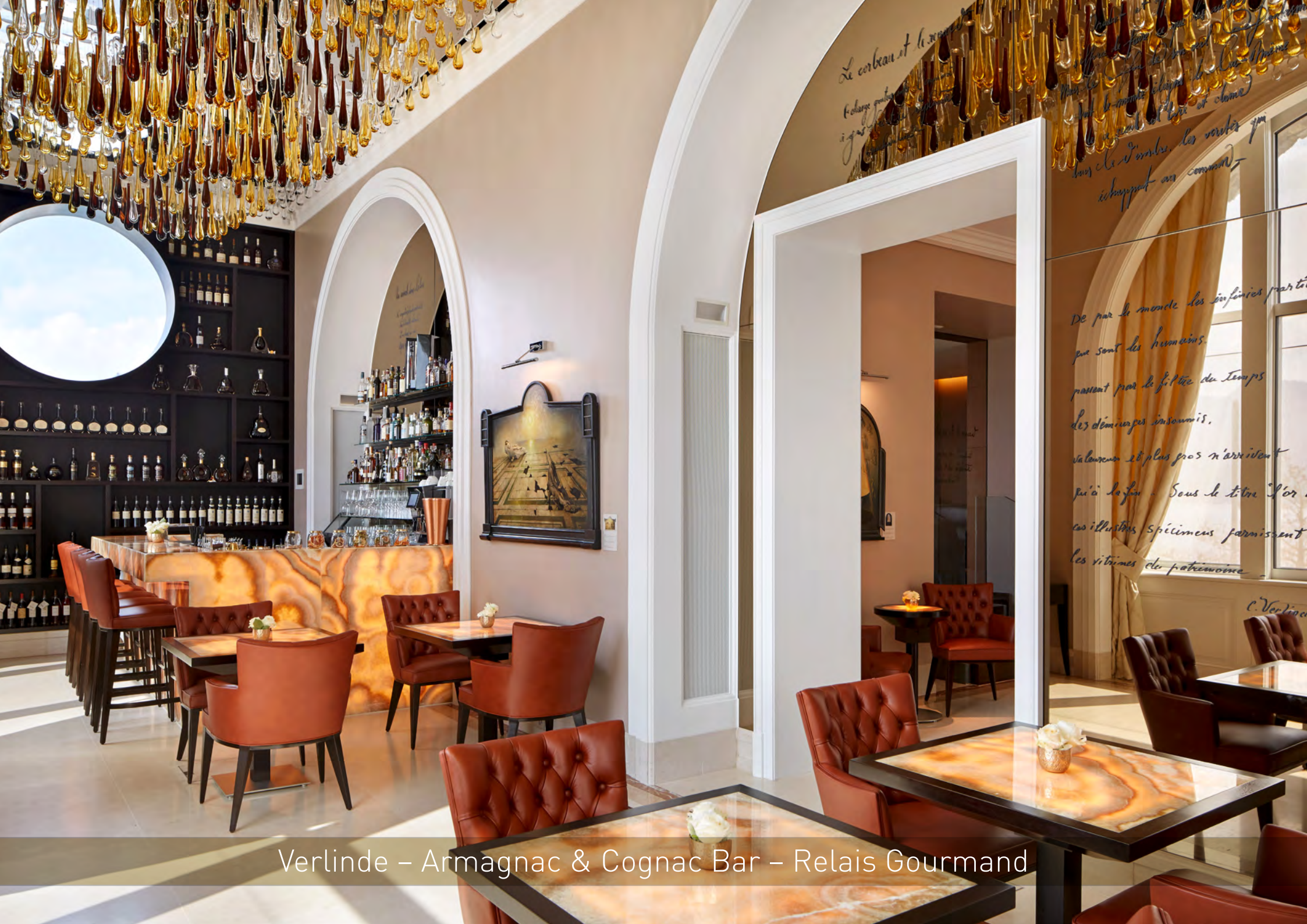
Verlinde – Armagnac & Cognac Bar – Relais Gourmand

Le corbeau et le renard L'oiseau gaudet à gaspiller Mais le renard est plus malin il se cache sous le ruisseau et attend le moment où l'oiseau s'écartera pour aller à l'eau et boire et alors il se précipite et le mange