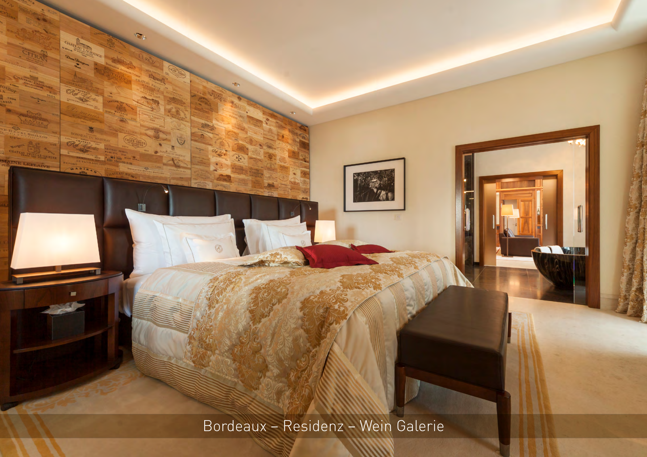
Bordeaux – Residenz – Wein Galerie