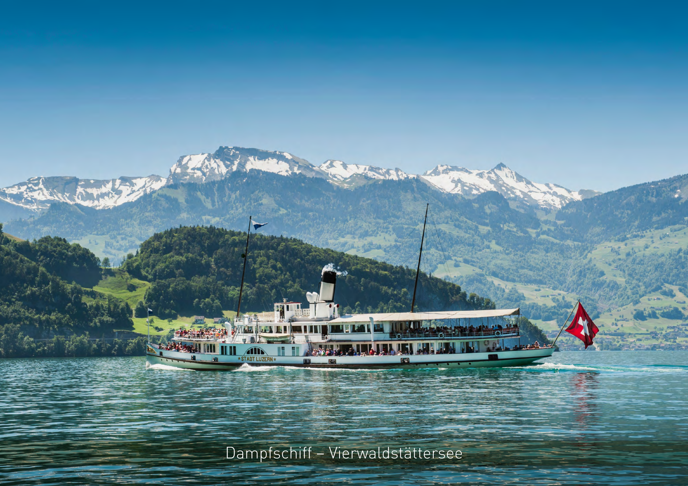
Dampfschiff – Vierwaldstättersee