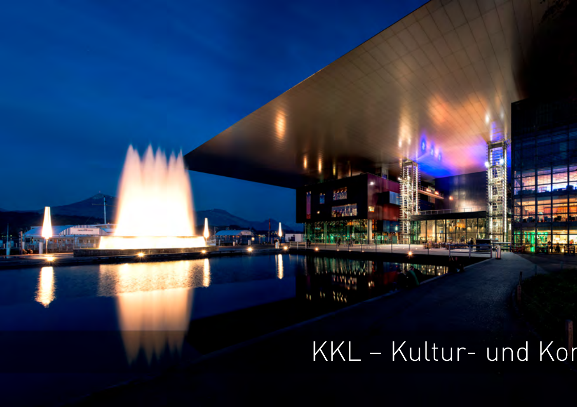
KKL – Kultur- und Kongresszentrum Luzern