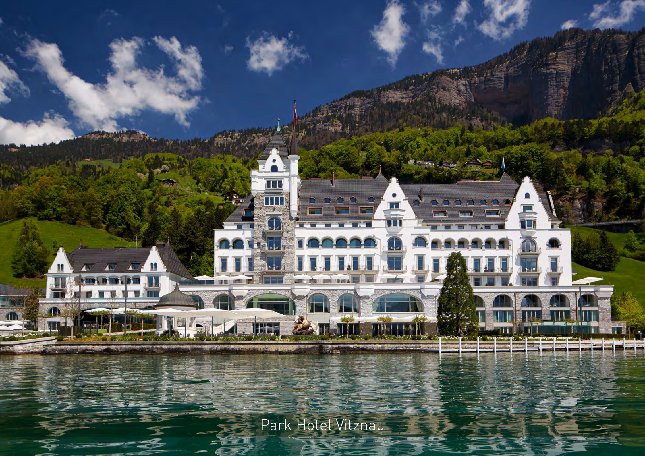
Park Hotel Vitznau