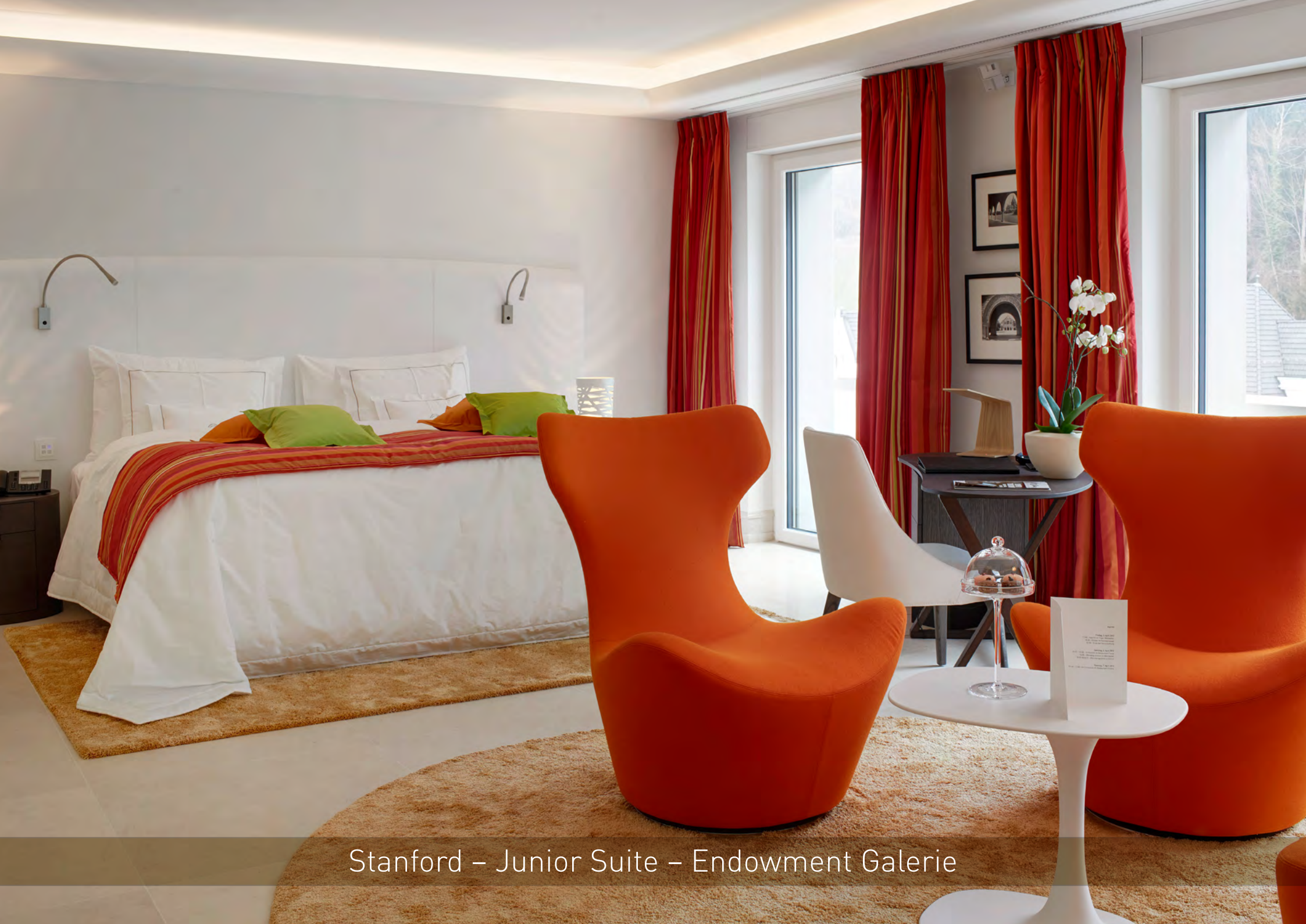
Stanford – Junior Suite – Endowment Galerie