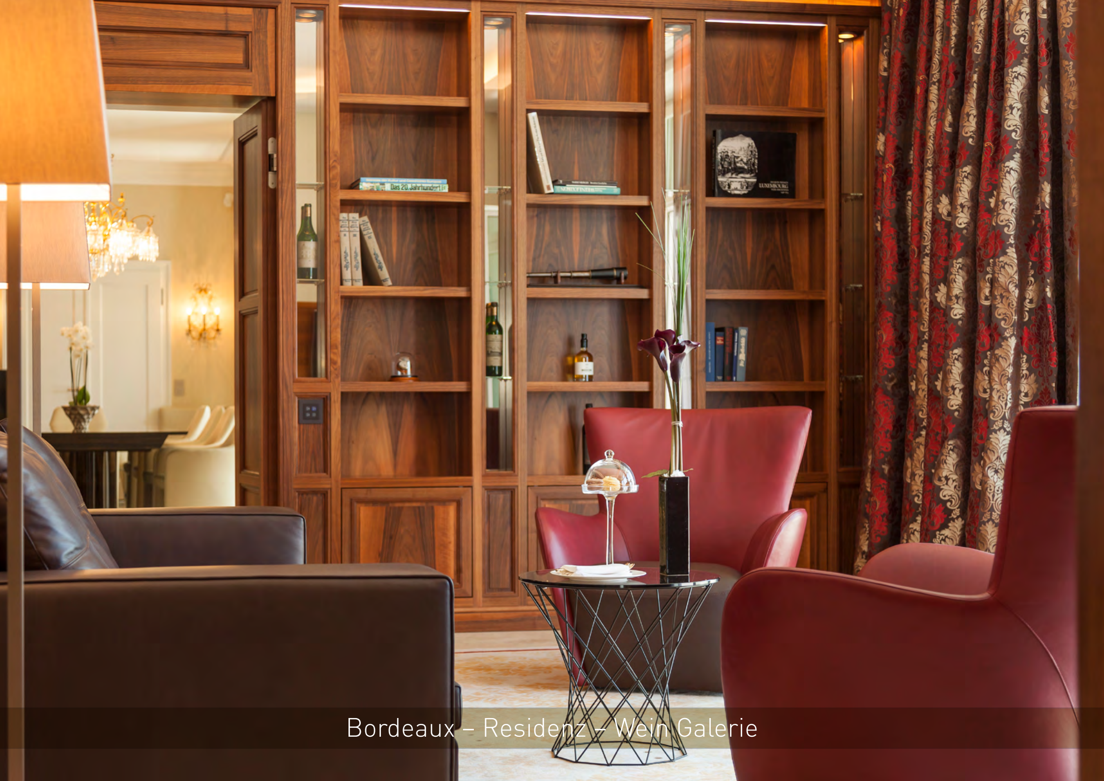
Bordeaux – Residenz – Wein Galerie