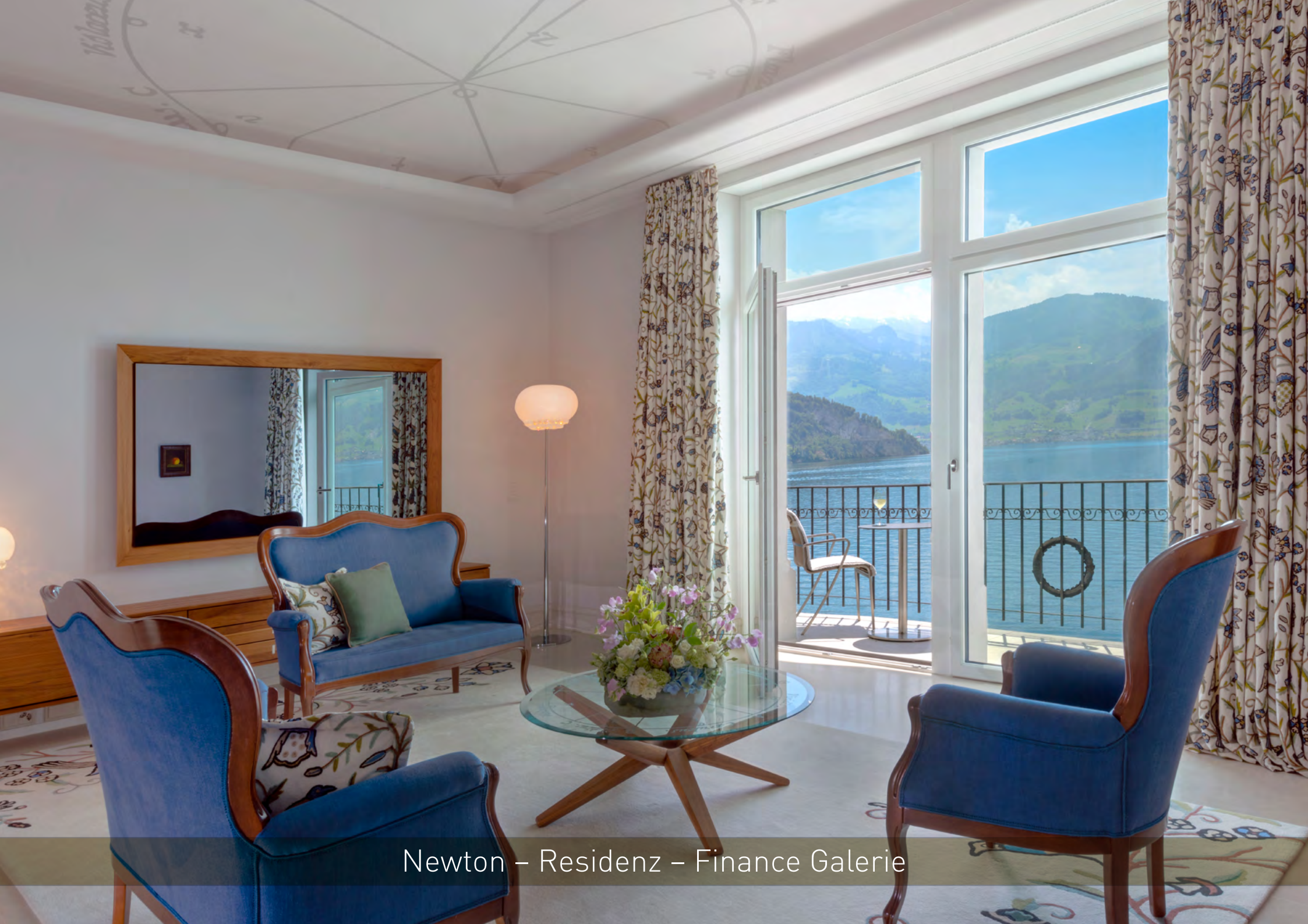
Newton – Residenz – Finance Galerie