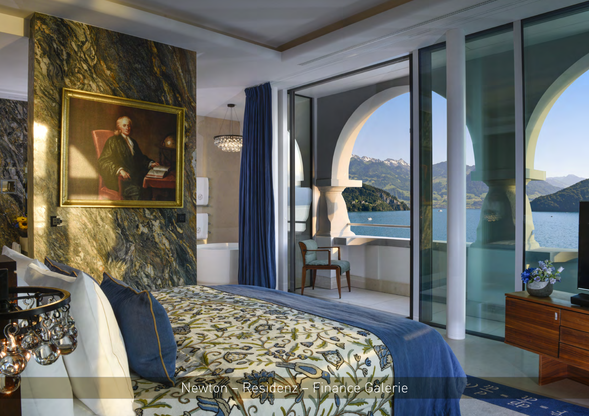
Newton – Residenz – Finance Galerie