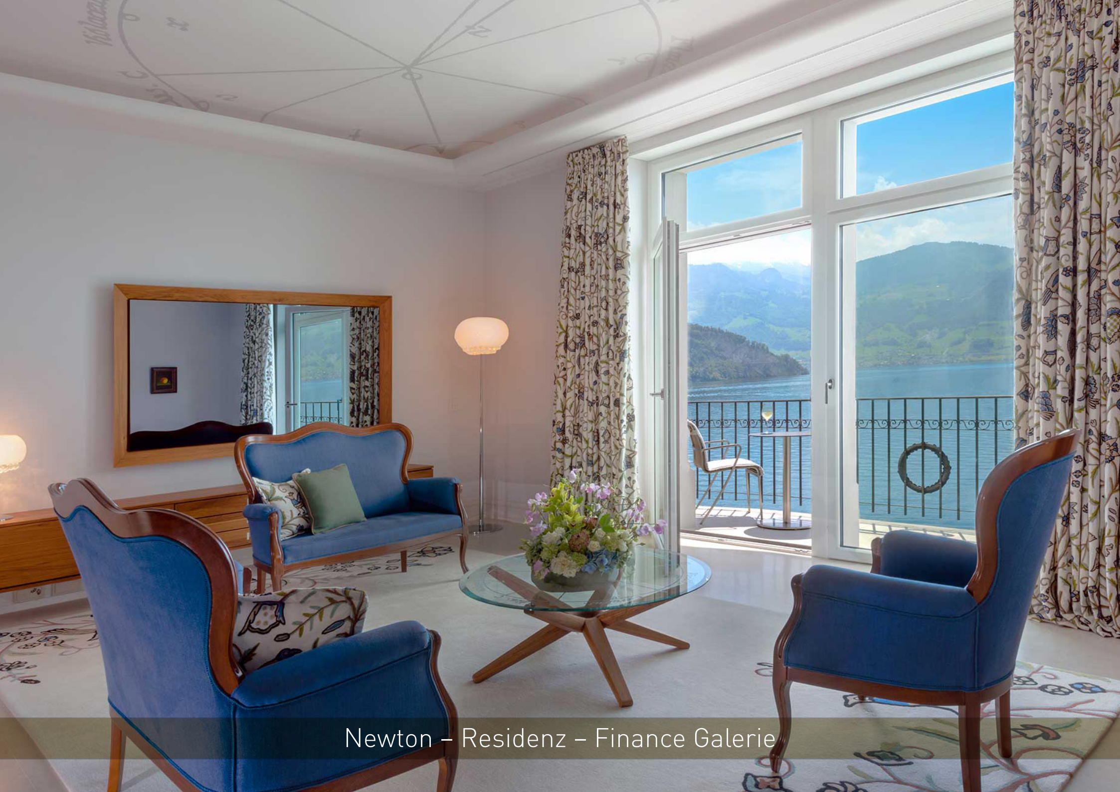
Newton – Residenz – Finance Galerie