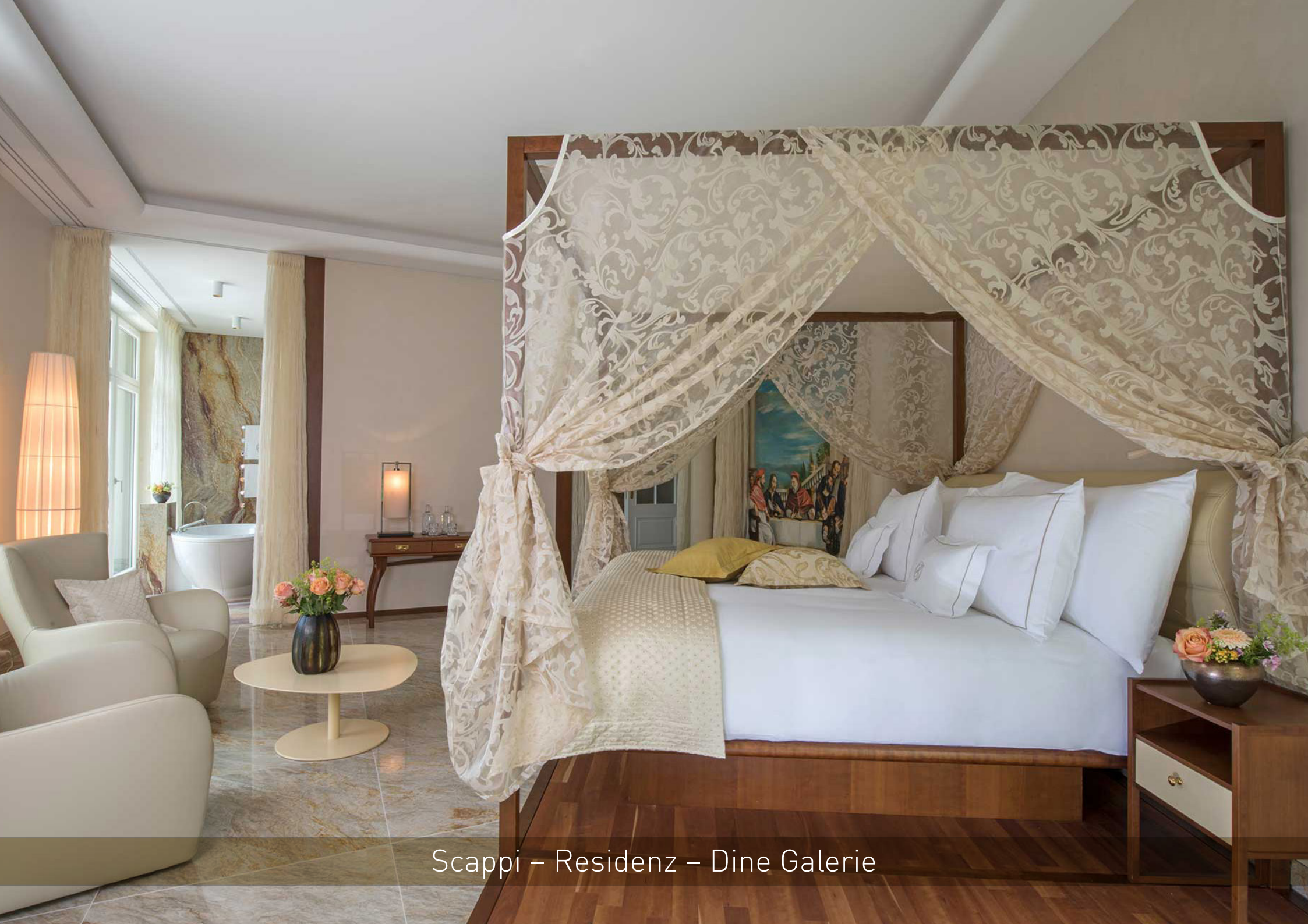
Scappi – Residenz – Dine Galerie