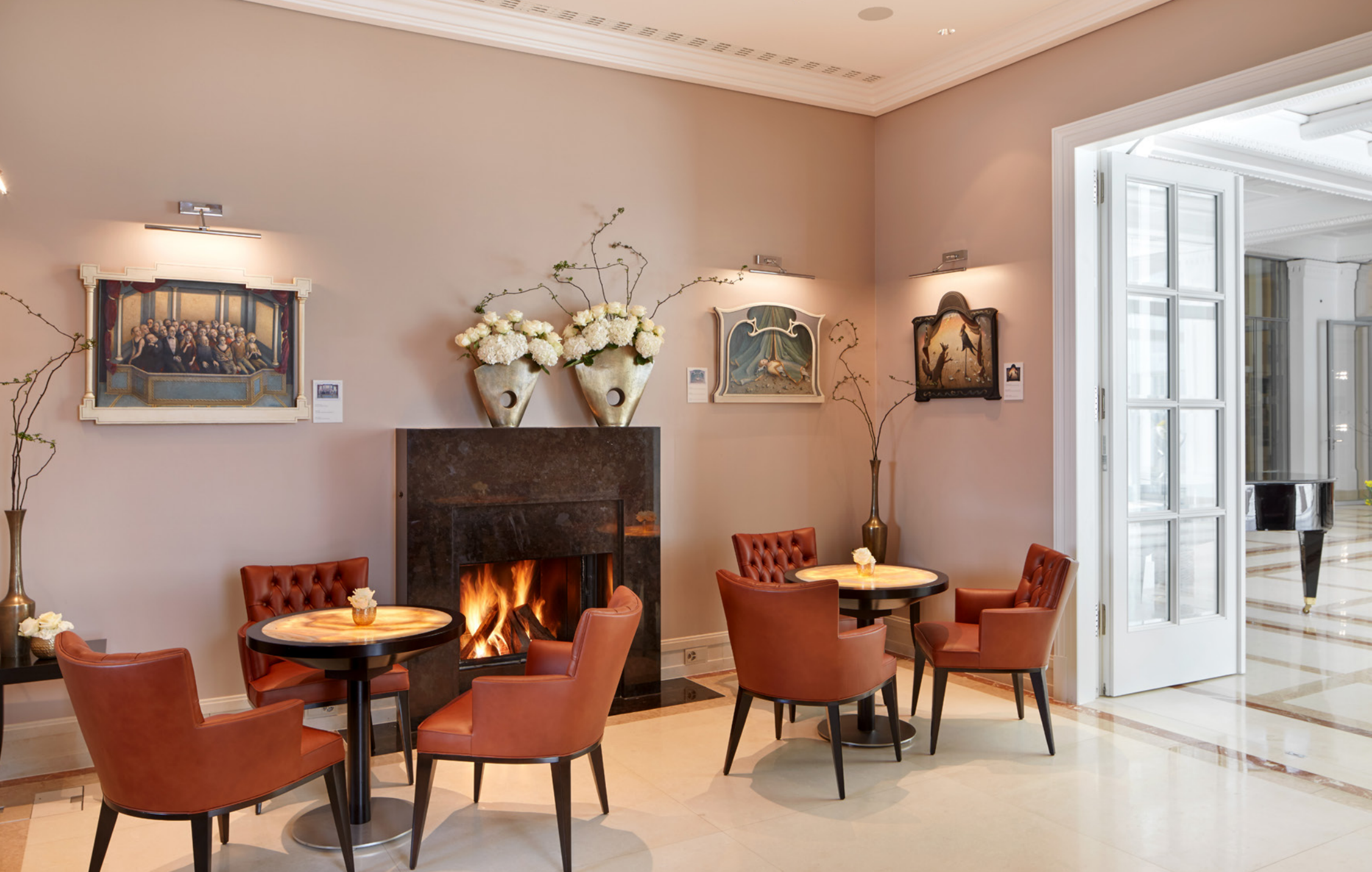
Verlinde – Armagnac & Cognac Bar – Relais Gourmand