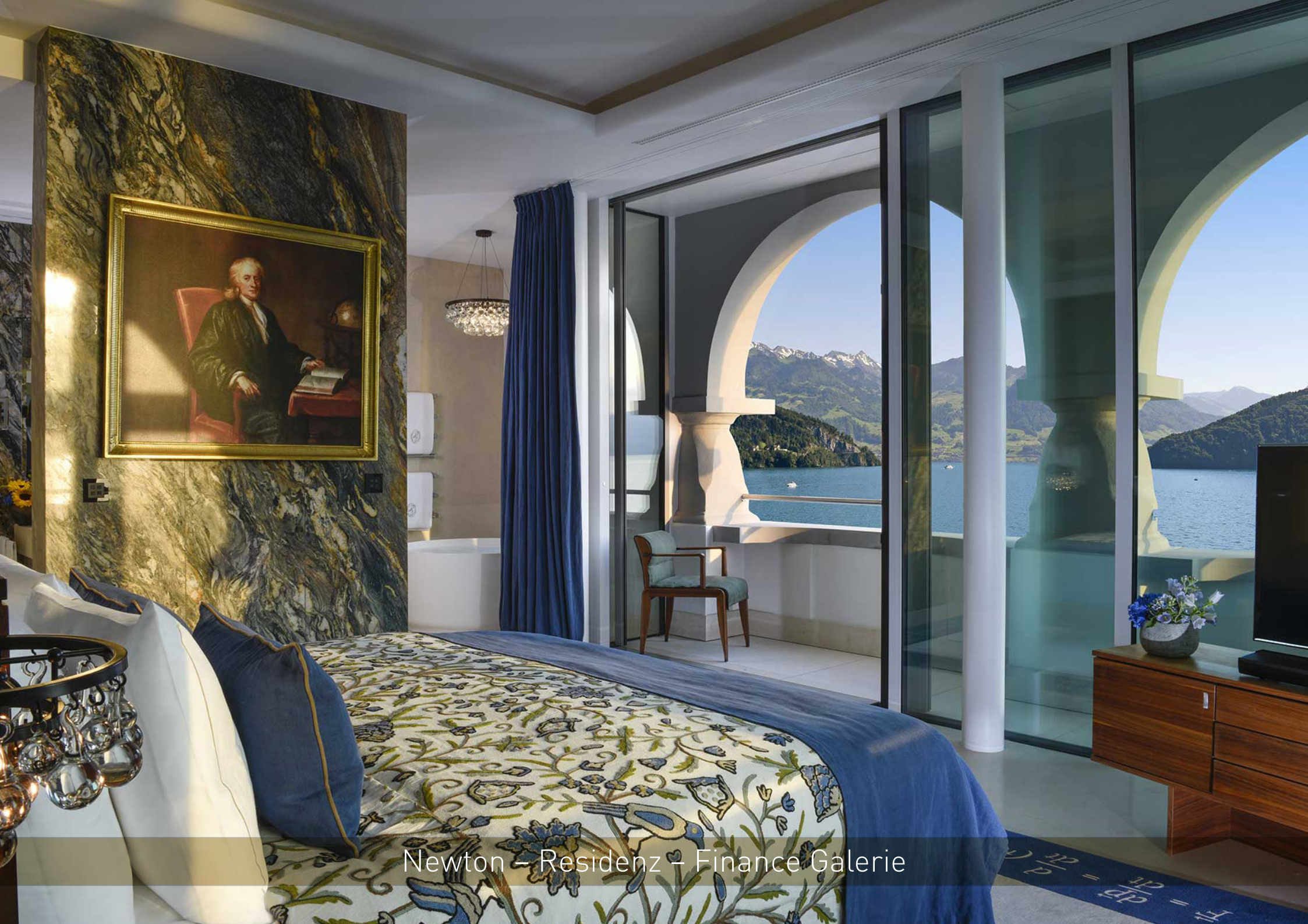
Newton – Residenz – Finance Galerie