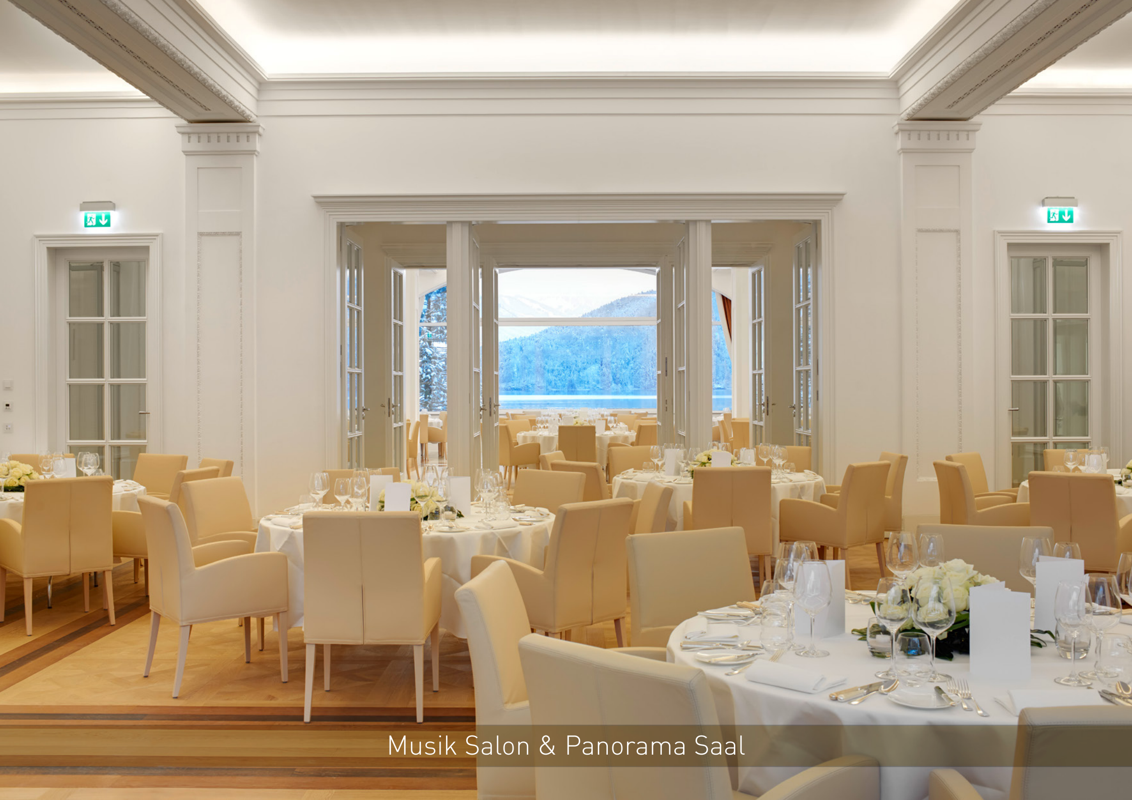
Musik Salon & Panorama Saal