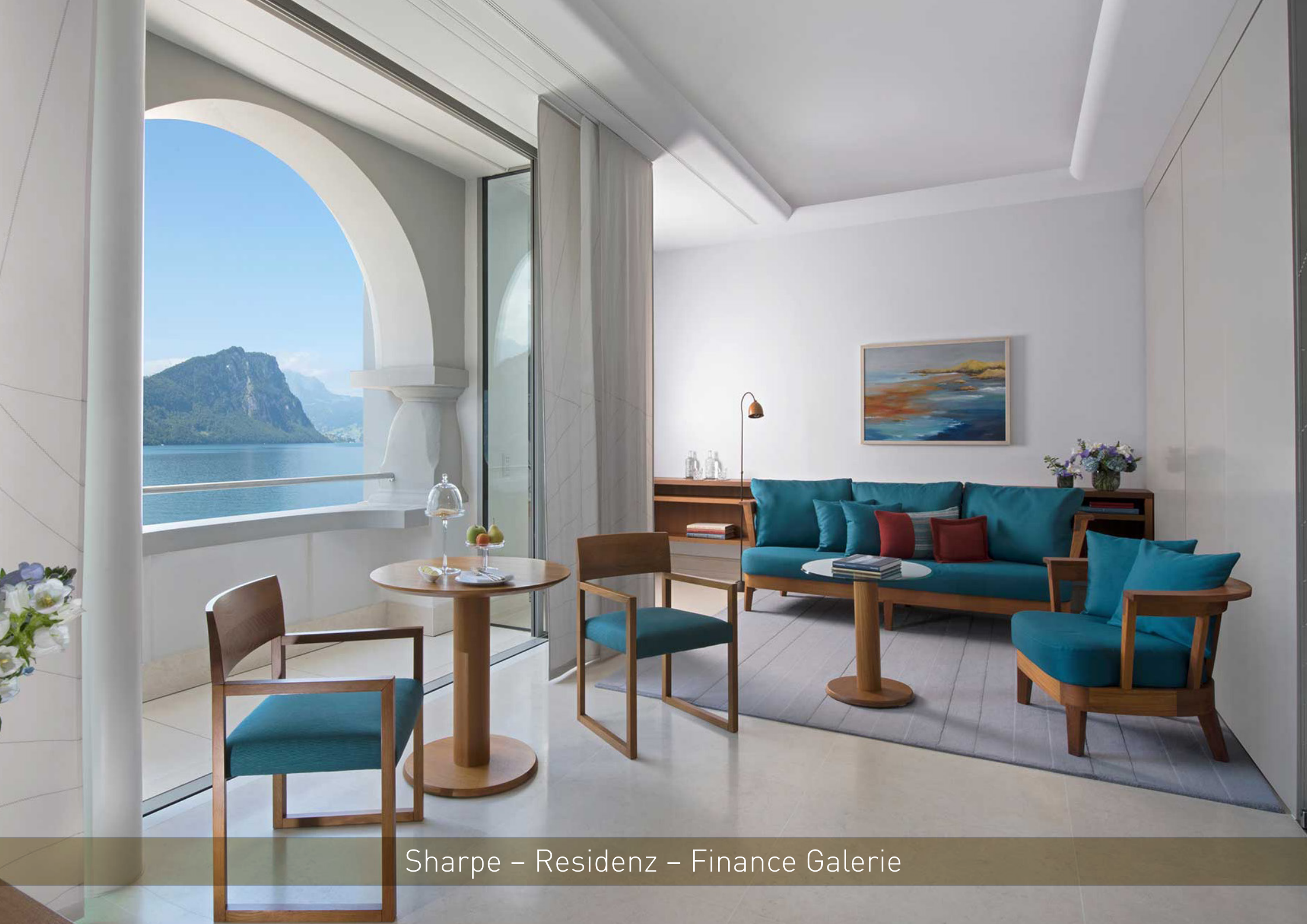
Sharpe – Residenz – Finance Galerie