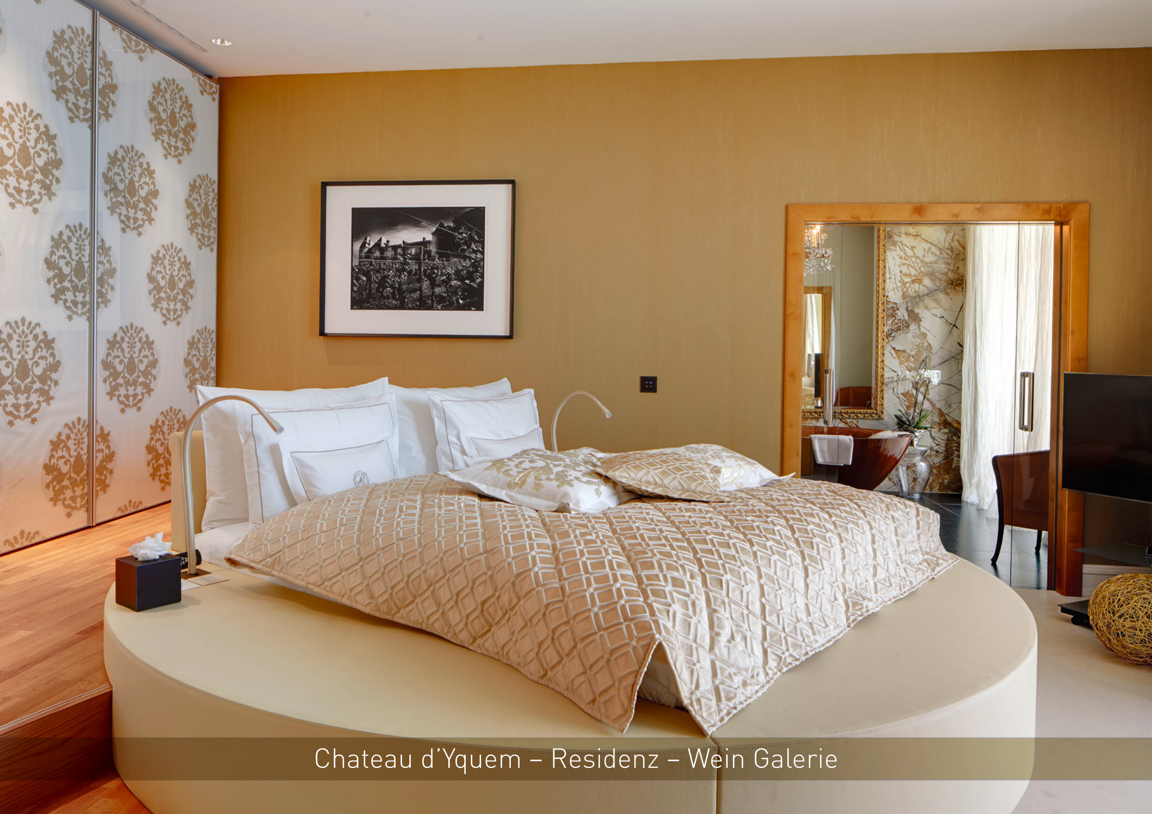
Chateau d'Yquem – Residenz – Wein Galerie