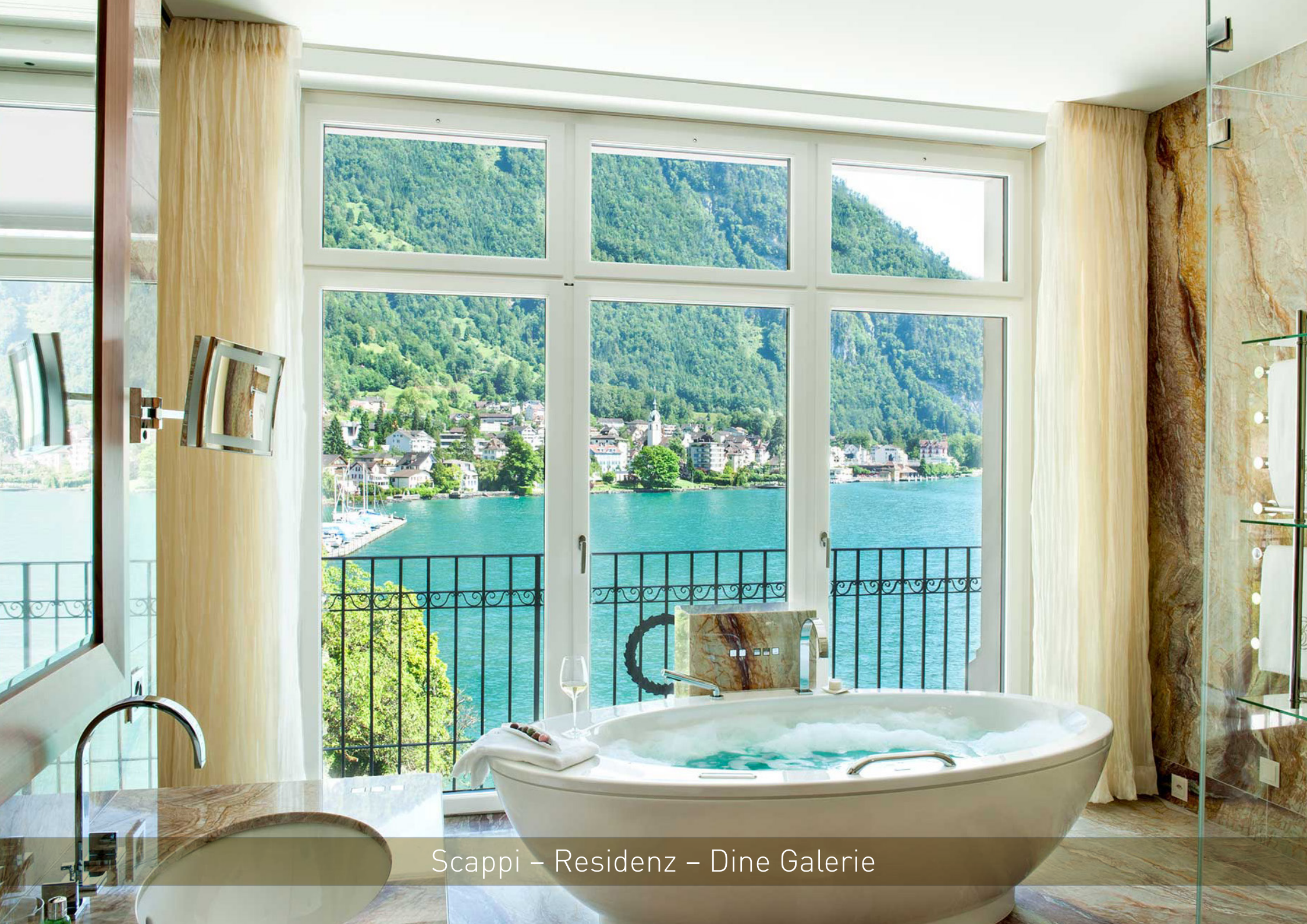
Scappi – Residenz – Dine Galerie