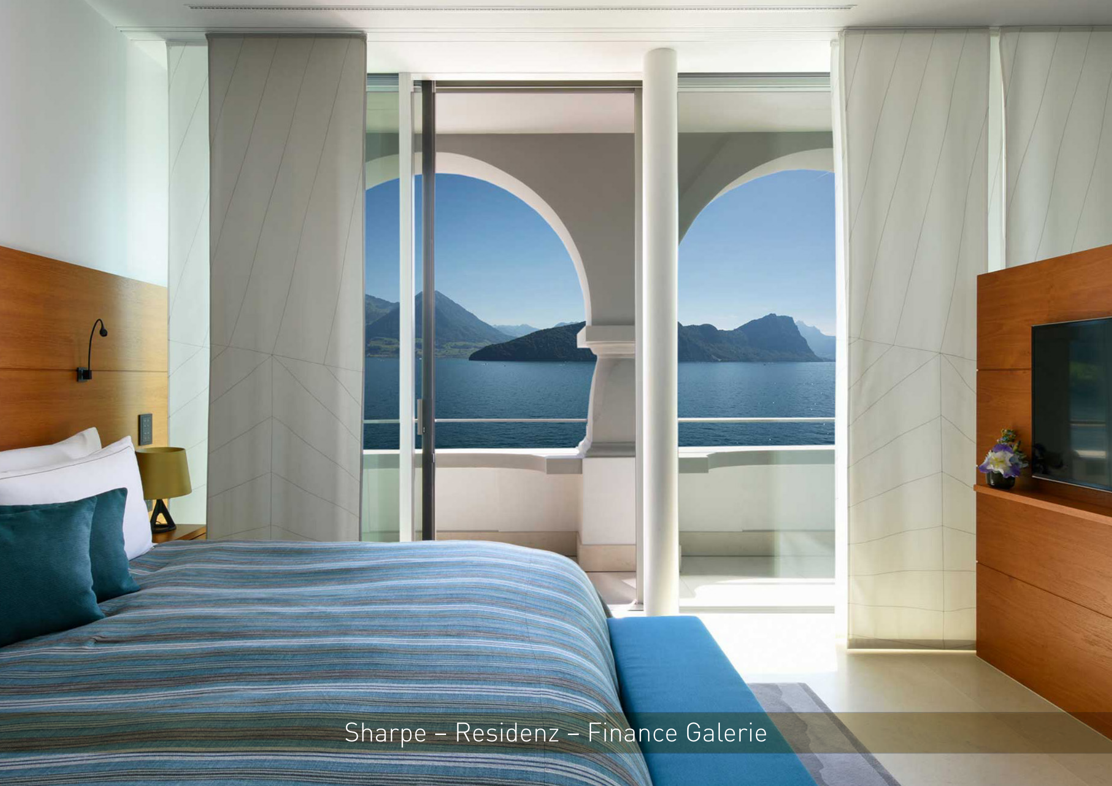
Sharpe – Residenz – Finance Galerie