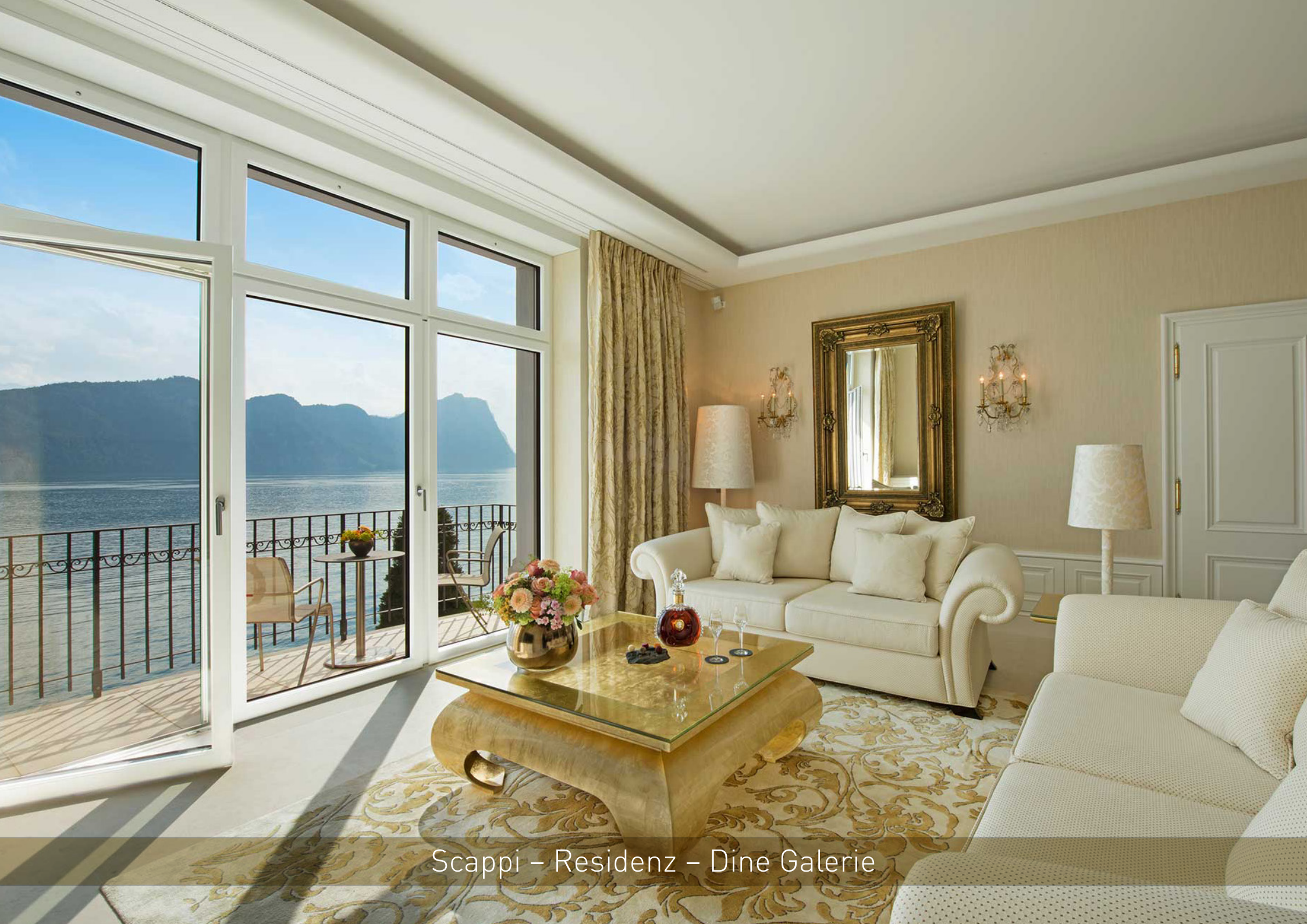
Scappi – Residenz – Dine Galerie