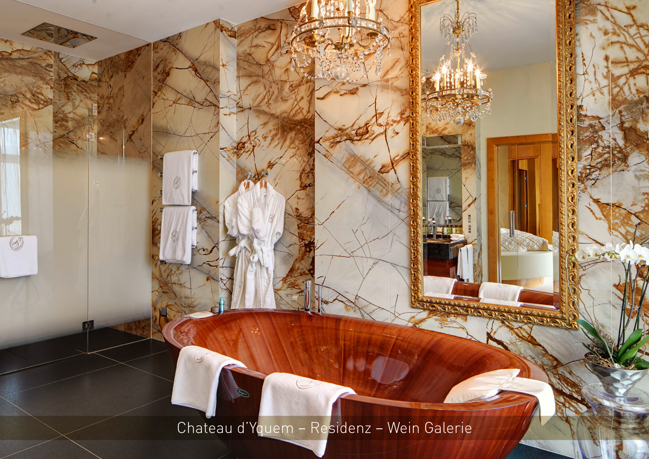
Chateau d'Yquem – Residenz – Wein Galerie