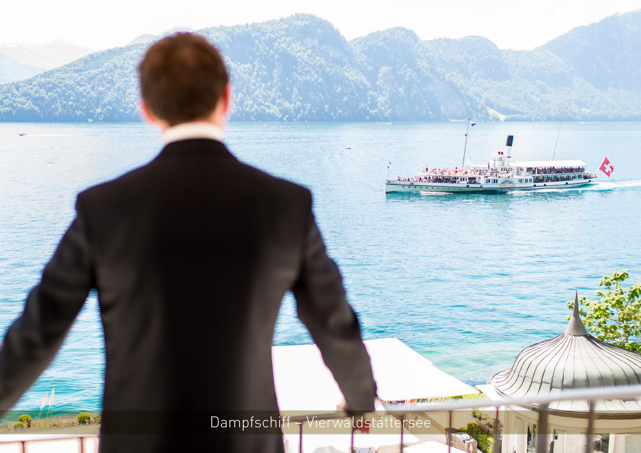
Dampfschiff – Vierwaldstättersee